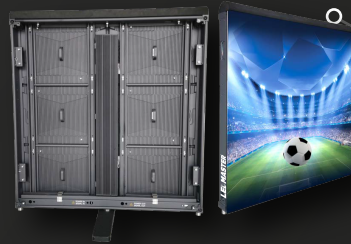
MERCURY SERIE DEPORTIVA