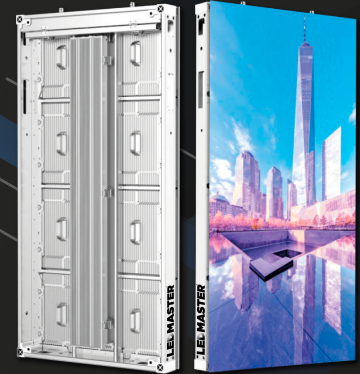
MERCURY SERIE S