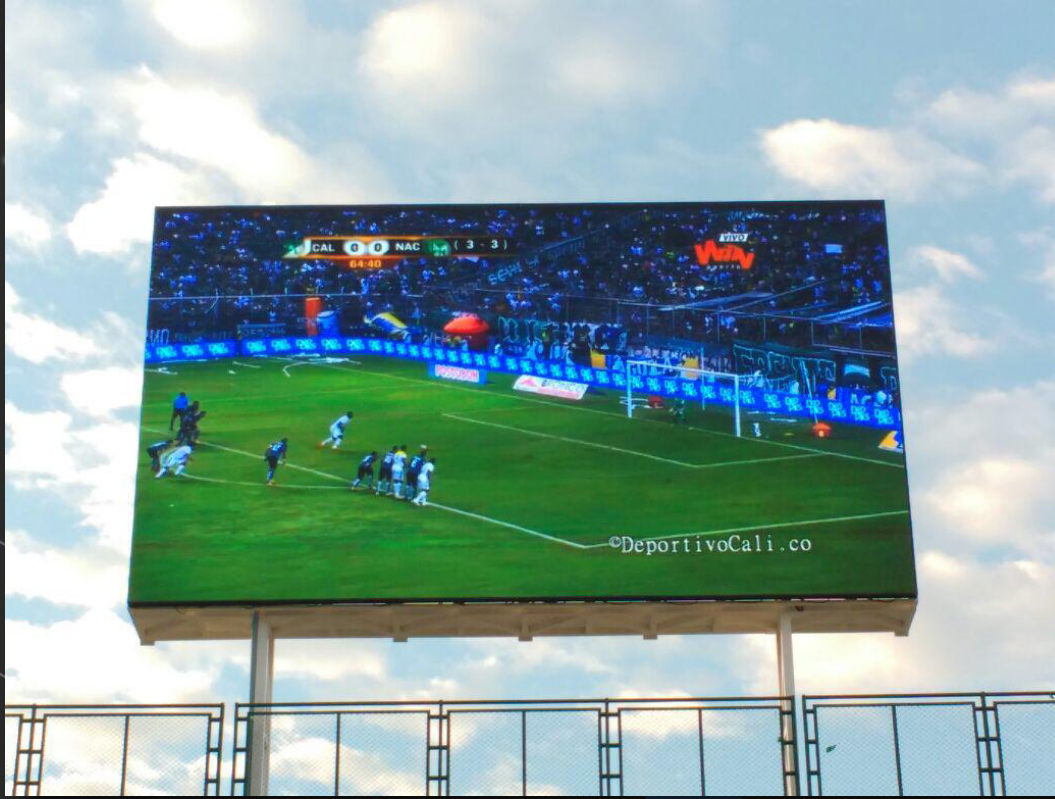
Pitch 10-Estadio Deportivo Cali