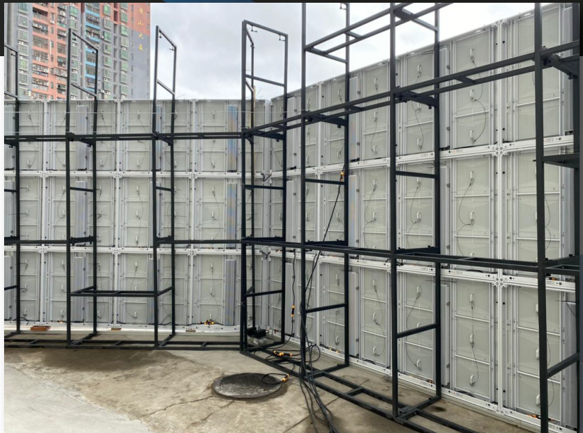
Montaje de pantalla